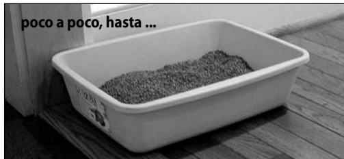
poco a poco, hasta ...