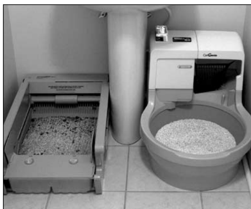
Conserve juntos el viejo arenero, sin limpiar, y CatGenie hasta que el gato cambie su hábito.

CADA GATO ES DIFERENTE y el modo en que sus propietarios afrontan el cambio a CatGenie puede afectar a la aceptación de la nueva caja por parte de los gatos. Hasta el 2009, ya hemos tenido experiencia con casi 100.000 gatos y sus propietarios. También hemos trabajado con especialistas del comportamiento del gato y entrenadores. La actitud de los propietarios es crítica.