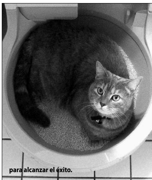
para alcanzar el éxito.