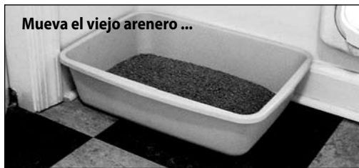
Mueva el viejo arenero ...