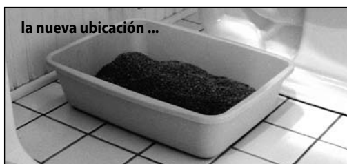
la nueva ubicación ...